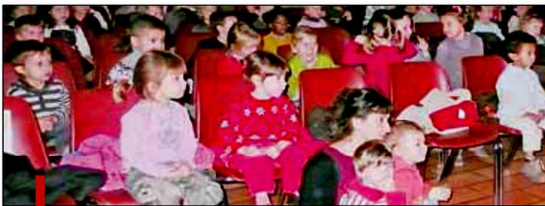
Les enfants écoutent attentivement les lutins qui veulent voir la mer.

La compagnie Univers Scène Théâtre est venue distraire, au centre culturel des Augustins, les enfants des écoles maternelles et élémentaires avec un spectacle de Noël, intitulé "Veux voir la mer!".